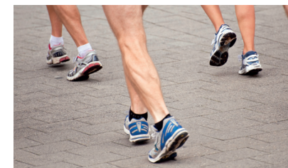
A prática de exercício físico ajudam a manter os níveis de colesterol dentro dos valores ideais